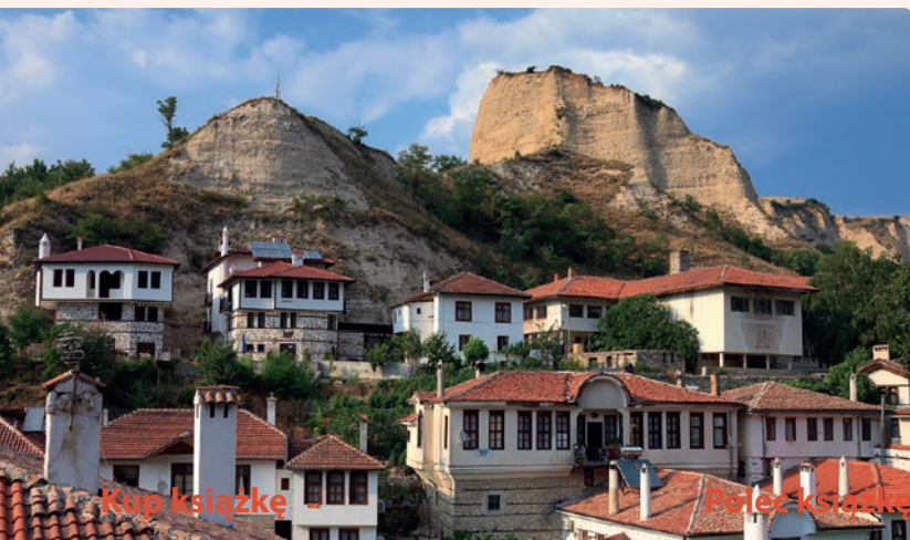
Widok na Melnik

Melnik to miasto muzeum, w którym 96 budynków uznano za zabytki przeszłości. Przypominające twierdze domy na pirińskich stokach, stare kościoły, malutkie uliczki i otaczające Melnik góry – to wszystko nadaje miastu niepowtarzalnego klimatu. Więcej zob. s. 141.