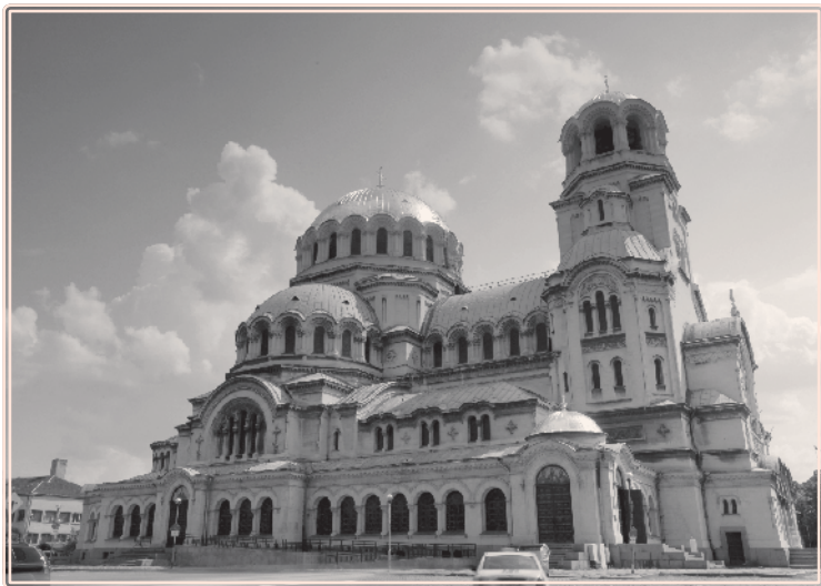
Sobór św. Aleksandra Newskiego

(🕒 codz. oprócz pn. 10.00–18.00; dorośli 6 lw, uczniowie, studenci, renciści i emeryci 3 lw; 🌐 www.nationalartgallerybg.org) prezentuje przede wszystkim malarstwo i rzeźbę. W zbiorach ma ogromną kolekcję dzieł najwybitniejszych bułgarskich klasyków. Najstarsze pochodzą z XVIII w.